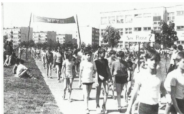
V Bieg „O Srebrne Czółenka Włókniarskie”