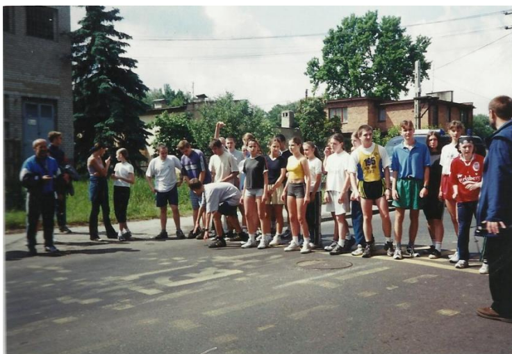
Start XVIII edycji imprezy.