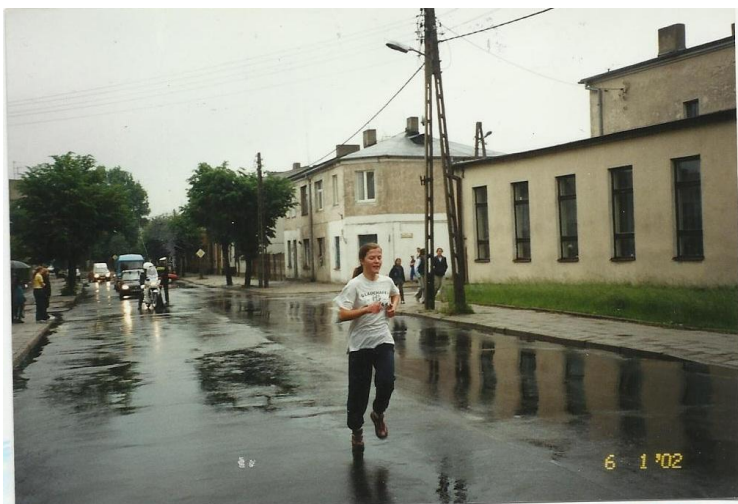
Jedna z zawodniczek w czasie XIX edycji „Czółenka”.